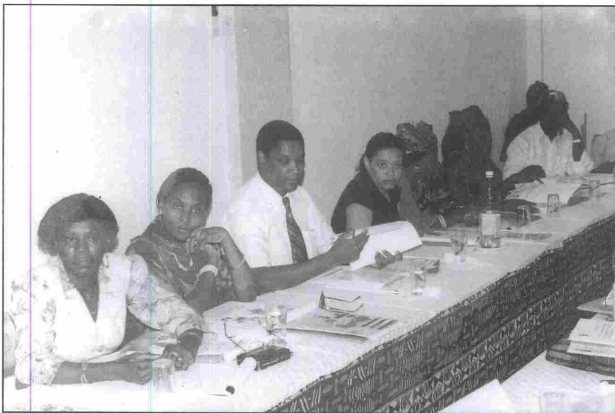
.... dans la mise en oeuvre, le suivi et l'évaluation du Programme d'Action de Ouagadougou concernant la Population et le Développement Durable dans le Sahel.