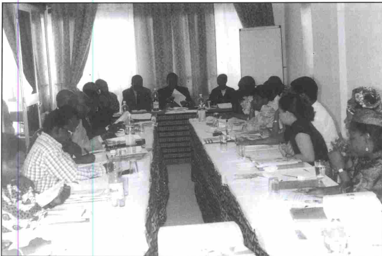
Les journalistes membres du Réseau Sahélien de Diffusion de l'Information sur la Population ont pris l'engagement de s'impliquer...