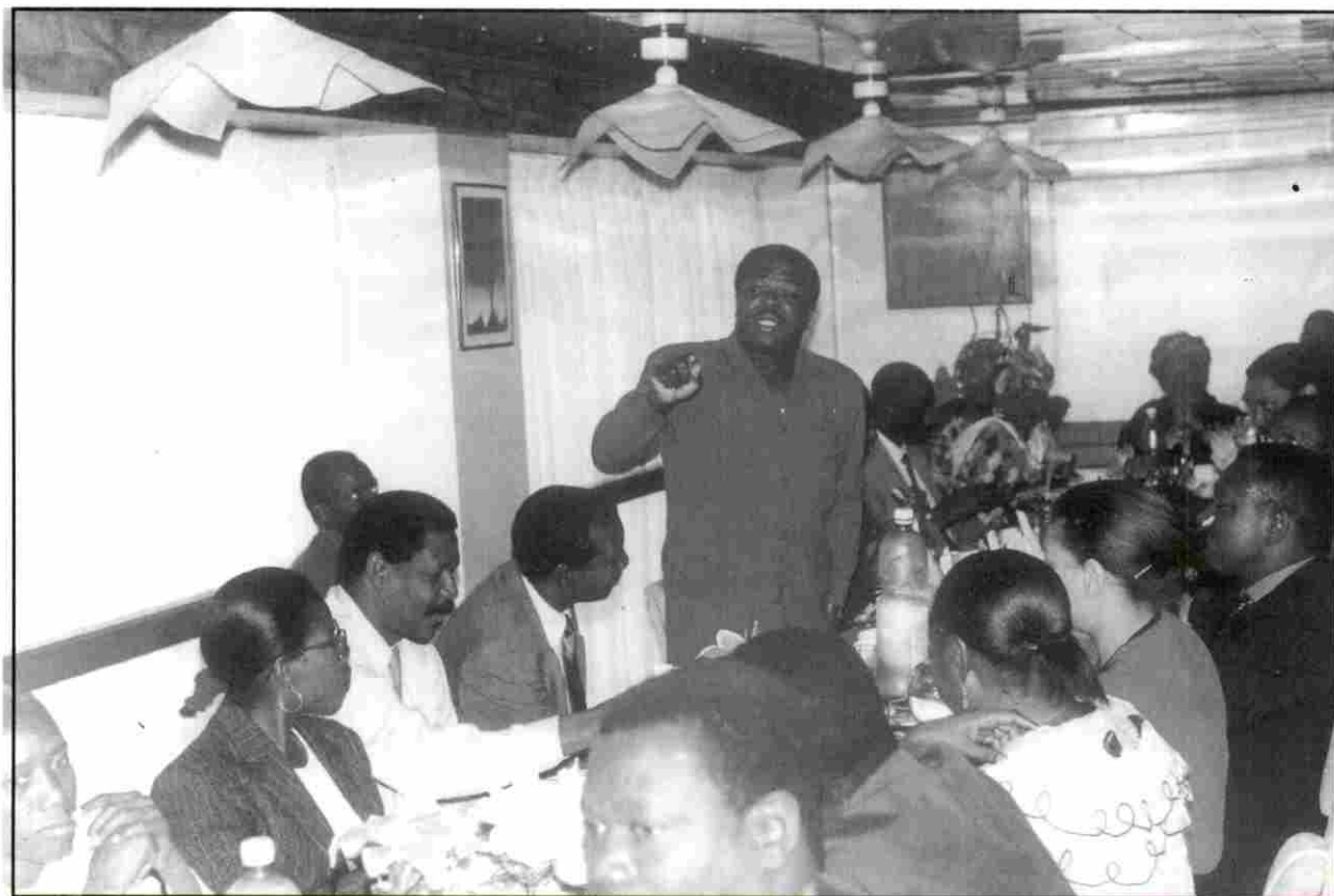
....lors du petit déjeuner de presse organisé dans le cadre de la campagne nationale sur «les violences faites aux femmes»